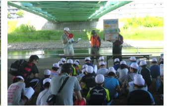
川に近づく時はルールを守って事故のないように注意しよう。