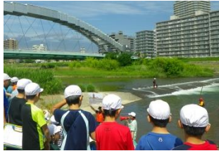
床止めの周辺は巻きこむ流れがあり、脱出しにくく危険です。