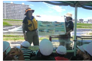
豊平川に棲む魚や水生昆虫をパネルで学び、実際に捕獲した魚を観察しました。