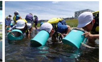
川の中や川底がどのようなになっているかを箱メガネで観察しました。