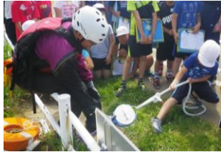
川に流された人の救助には、大きな力が必要なことを学習しました。