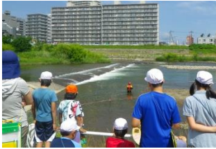
川の深さは場所によって急変し見た目ではわかりません。