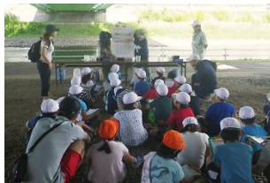
調べた結果から、川が「きれい」か「よごれている」のかパネルを見て学習しました。