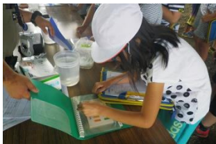
豊平川の水質を簡易測定キットを使って調べました。