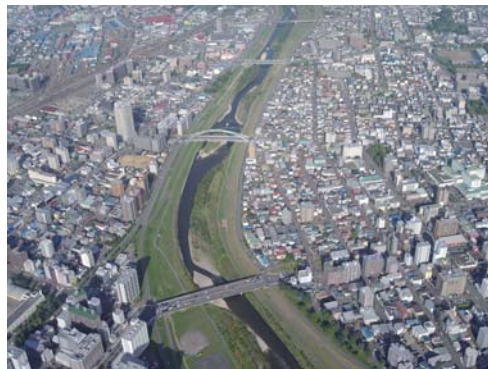
一条大橋上空付近から豊平川下流を望む