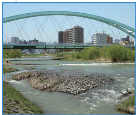
水穂大橋下流右岸では、遡上サケを間近で見られるかもしれません

● 少年野球場 (1面) ● 無料 ◎ 川下公園管理事務所 011-879-5311