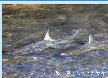
秋に遡上してきたサケ