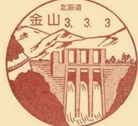
金山ダム・大雪山連峰 金山郵便局