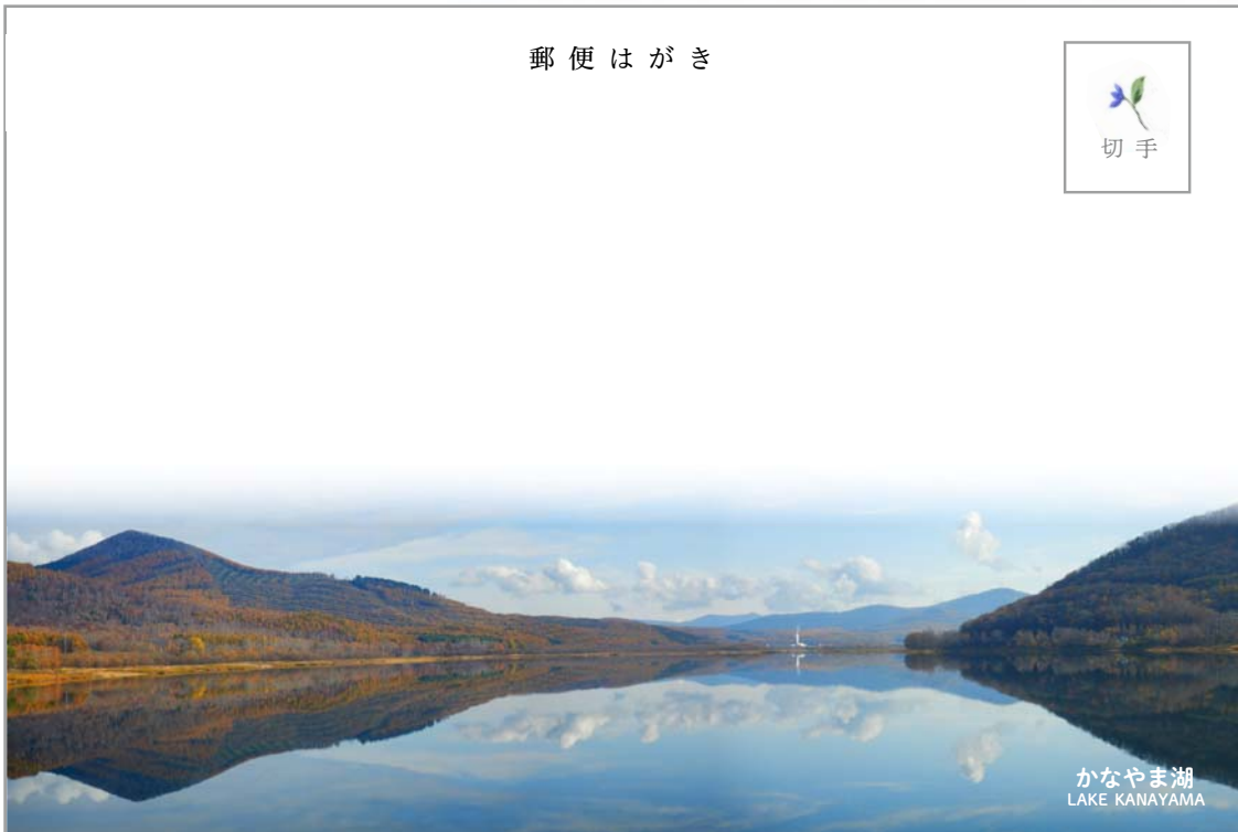
かなやま湖 LAKE KANAYAMA