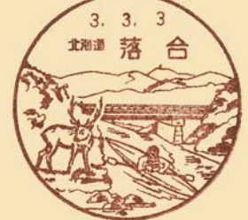
空知川・カヌー・エジンカ・落合岳 落合郵便局