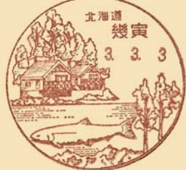
かなやま湖・イトウ・カラマツ林・ログハウス 幾寅郵便局