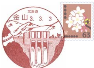
押印イメージ（金山の例）