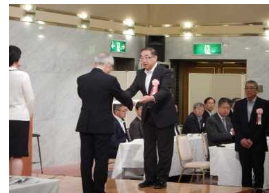
表彰式:平成29年6月27日 アルカディア市ヶ谷(東京都千代田区)