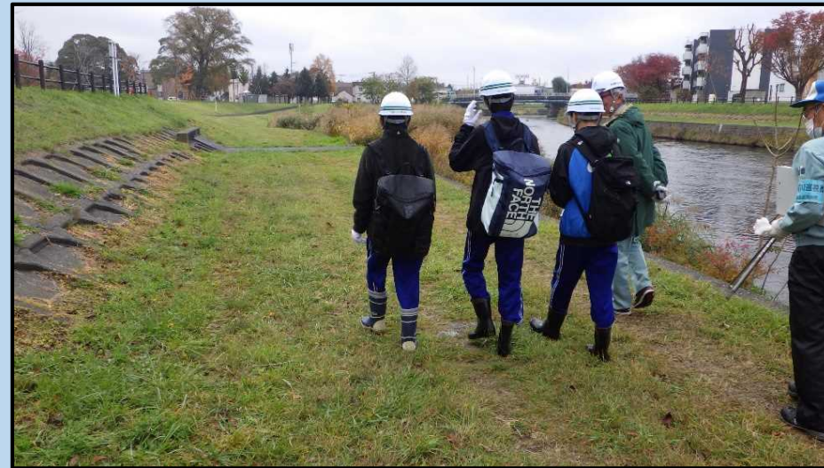
河川巡視の様子。河川管理施設や許可工作物の状況等を目視で確認を行いました。