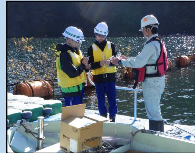
漁川ダム訪問の様子。ダム施設概要説明や内部の見学のほか、貯水池の水質調査も行いました。