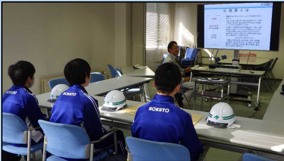
事業概要紹介の様子。河川の仕事の概要について理解を深めました。