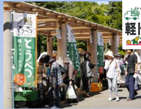
札幌市内のイベント会場で採れたて野菜や花などを販売

本地域は、石狩振興局管内の石狩郡当別町に位置し、石狩川水系当別川下流に拓けた農業地帯である。地域の営農は水稻を基幹として、小麦、豆類などのほか、かぼちゃ等の野菜類、花き類を組み合わせた複合経営が展開されている。