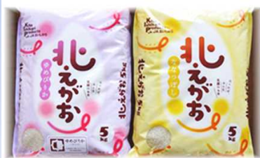
JA北いしかりのブランド米「ゆめぴりか」と「ななつぼし」