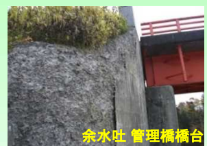
余水吐 管理橋橋台