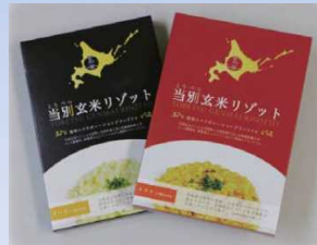
産官学連携によるブランド商品を開発「とうべつ玄米リゾット」