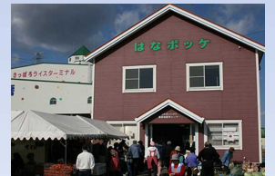
地元人気直売所「はなポッケ」