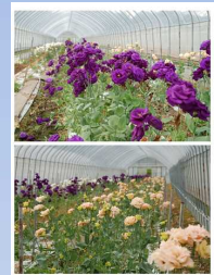
北海道内屈指の花の産地（ゆり、カーネーション等）