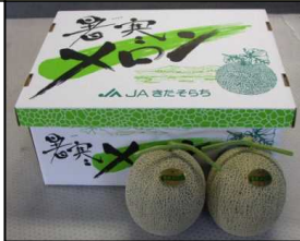
貴重な青肉メロン