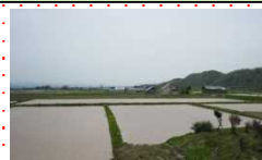
小区画で不整形なほ場

また、地区内の農地の一部で耕作放棄地が発生しているほか、未整備のままでは耕作放棄地のおそれとなる農地も存在している。