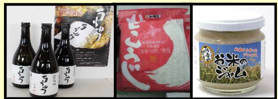
雨竜町内で作付けされた 酒米(吟風)100% 純米吟醸「うりゅう」 雨竜産米を活用した加工品