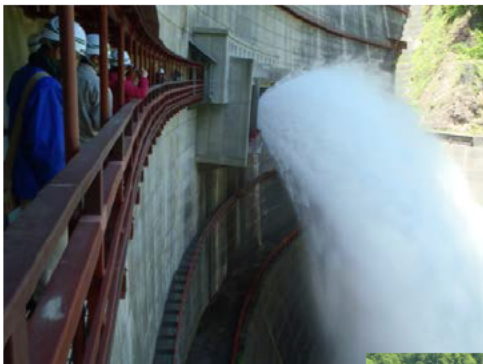
キャットウォークから望む