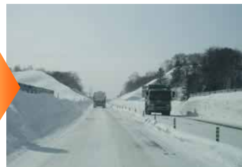
冬期の豊富バイパス