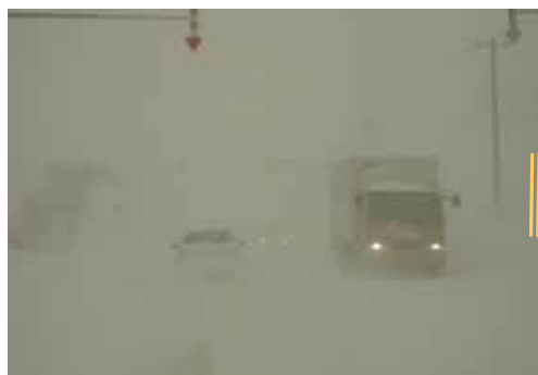
国道40号での視界不良状況