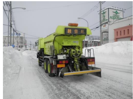
<凍結防止剤散布車>

凍結防止剤散布車で坂道や交差点部などで発生したツルツル路面へ凍結防止剤(塩化ナトリウム等)や防滑材を散布します。