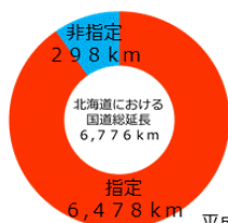
平成29年4月現在 北海道開発局調べ