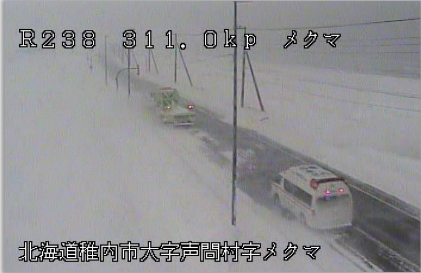
北海道電力(株)の車両の誘導(停電対応) 2日 5:20頃