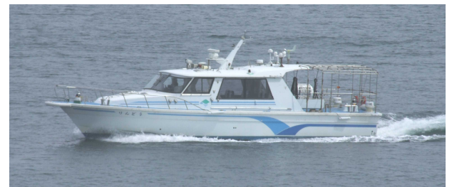
港湾業務艇「りんどう」