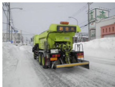
<凍結防止剤散布車>

凍結防止剤散布車で坂道や交差点部などで発生したツルツル路面へ凍結防止剤(塩化ナトリウム等)や防滑材を散布します。