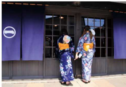
2017年グランプリ作品 【涼風】