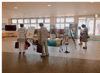
7月11日～24日 名寄市「よろーな」