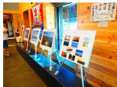
8月17日 道の駅「おびら鯉番屋」