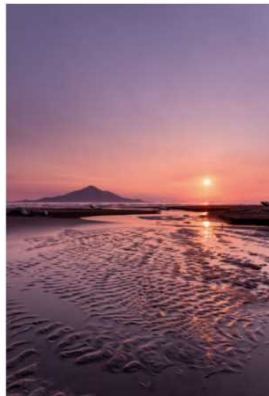
2015年グランプリ作品 【夕日に染まる砂紋】

フォトコンテスト受賞作品は写真パネルにして道の駅や観光拠点での展示を行っています。