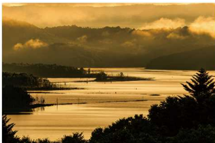
2018年グランプリ作品 【朱鞠内湖の朝】