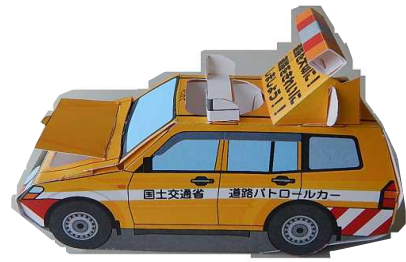
完成した道路パトロールカー