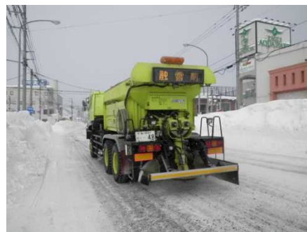
<凍結防止剤散布車>

凍結防止剤散布車で坂道や交差点部などで発生したツルツル路面へ凍結防止剤(塩化ナトリウム等)や防滑材を散布します。