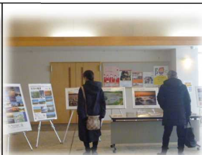
2月9日～18日 稚内市立図書館