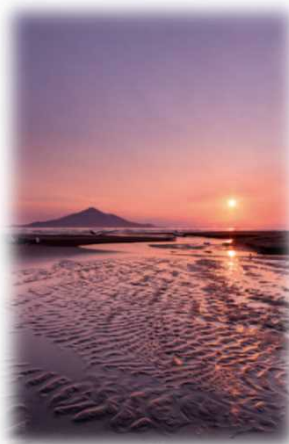
2015年グランプリ作品 【夕日に染まる砂紋】

フォトコンテスト受賞作品は写真パネルにして道の駅や観光拠点での展示を行っています。