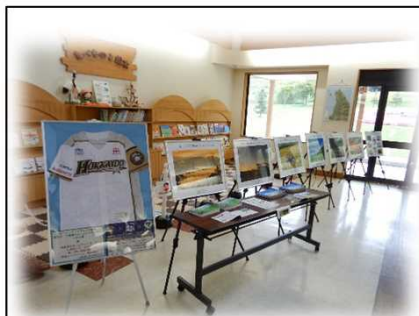
9月8日～9月28日 道の駅「絵本の里けんぶち」