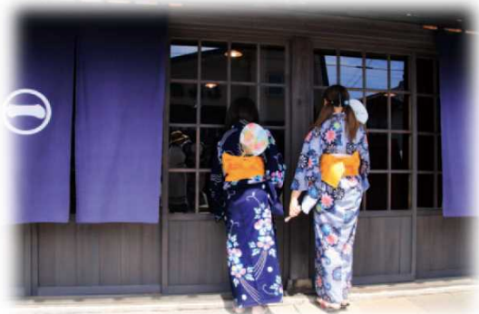
2017年グランプリ作品 【涼風】