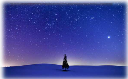
2020年グランプリ作品 【星空のステージ】