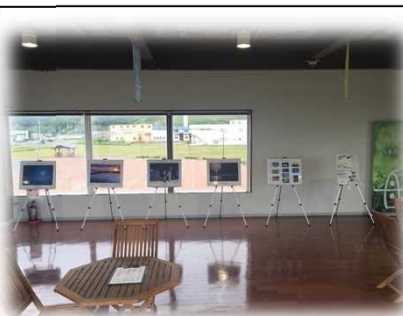
7月1日～9月7日 道の駅「るもい」