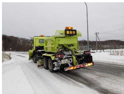
<凍結防止剤散布車>

凍結防止剤散布車で坂道や交差点部などで発生したツルツル路面へ凍結防止剤(塩化ナトリウム等)や防滑材を散布します。