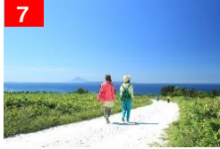
7 宗谷シーニックバイウェイ 大地の息吹を感じる宗谷周水河 (宗谷丘陵)の道(稚内市)