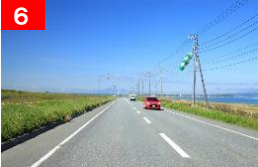
6 宗谷シーニックバイウェイ 秀峰・利尻山を望む道(稚内市)