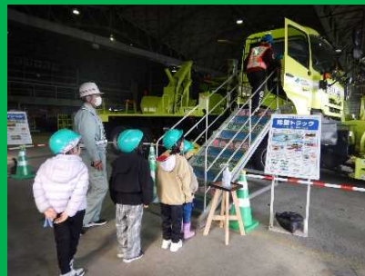
昨年度稚内市内小学校を対象に開催した「道路を守る車」の見学会の様子