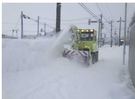
< 小型除雪車 >

小型除雪車に装備したロータリ装置やブレード装置により、歩道部に降り積もった雪を除雪します。