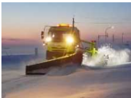
< 除雪トラック >

除雪トラックや除雪グレーダにより路側や路外に雪を寄せるほか、除雪ドーザにより交差点などを除雪します。