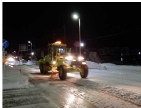
< 除雪グレーダ >