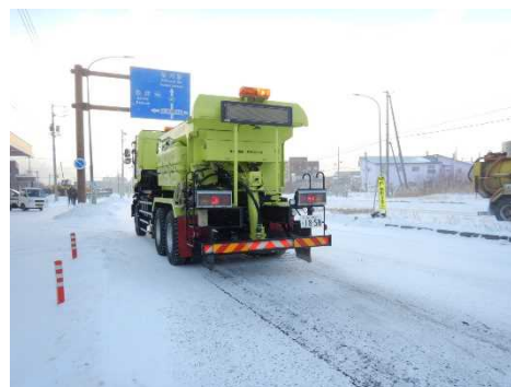
<凍結防止剤散布車>

凍結防止剤散布車により、坂道や交差点部などのツルツル路面において凍結防止剤(塩化ナトリウム等)や防滑材(砂)を散布します。