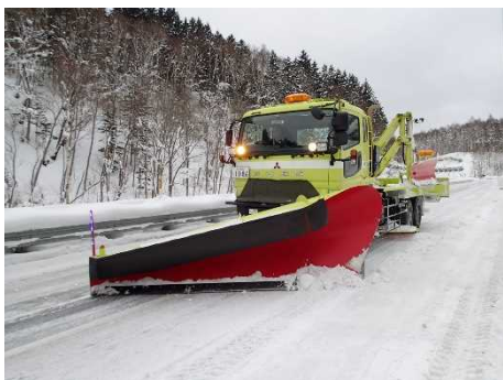
< 除雪トラック >

除雪トラックや除雪グレーダで、路面の圧雪や氷板を削り取り、車の走行に必要な幅員と路面の平坦性を確保します。