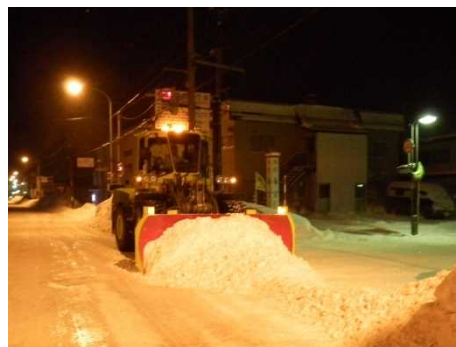
< 除雪ドーザ >