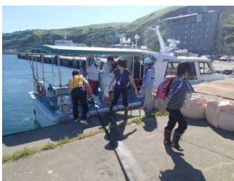
港湾業務艇で人員輸送