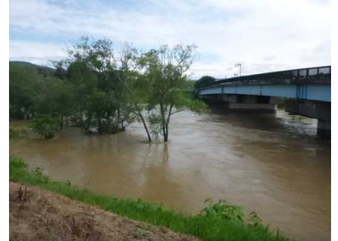
北見幌別川の水位(見送橋)