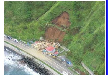
「ほっかい」からの映像