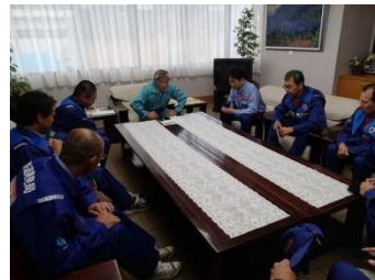
町長とTEC隊との打合せ