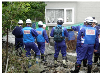
TEC隊による現地調査